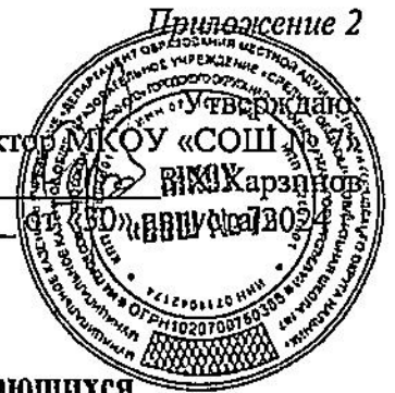
ГРАФИК родительского контроля за организацией питания обучающихся МКОУ «СОШ № 7» г.о.Нальчик на 2024-2025 учебный год